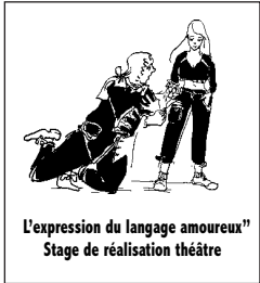
L'expression du langage amoureux" Stage de réalisation théâtre